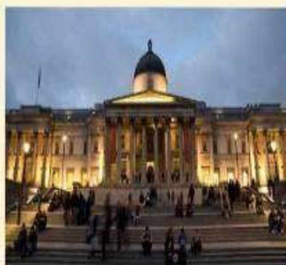
The National Gallery