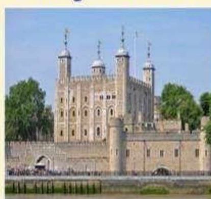
The Tower of London